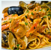
ERSTE MEERES HAUPTSPEISEN